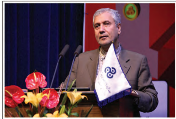
▲ سخنرانی وزیر محترم تعاون، کار و رفاه اجتماعی