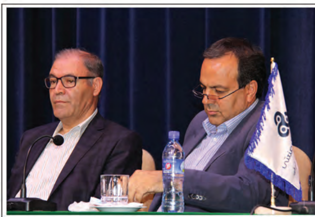
▲ حضور مقامات و مدیران بخش دولتی و خصوصی در دومین همایش معرفی برترین شرکت های منطقه آذربایجان