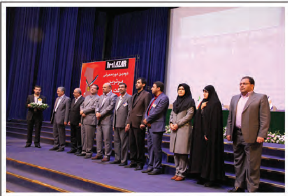
▲ اهداء تندیس و گواهی نامه برترین شرکت های منطقه آذربایجان توسط مقامات و مدیران بخش خصوصی و دولتی