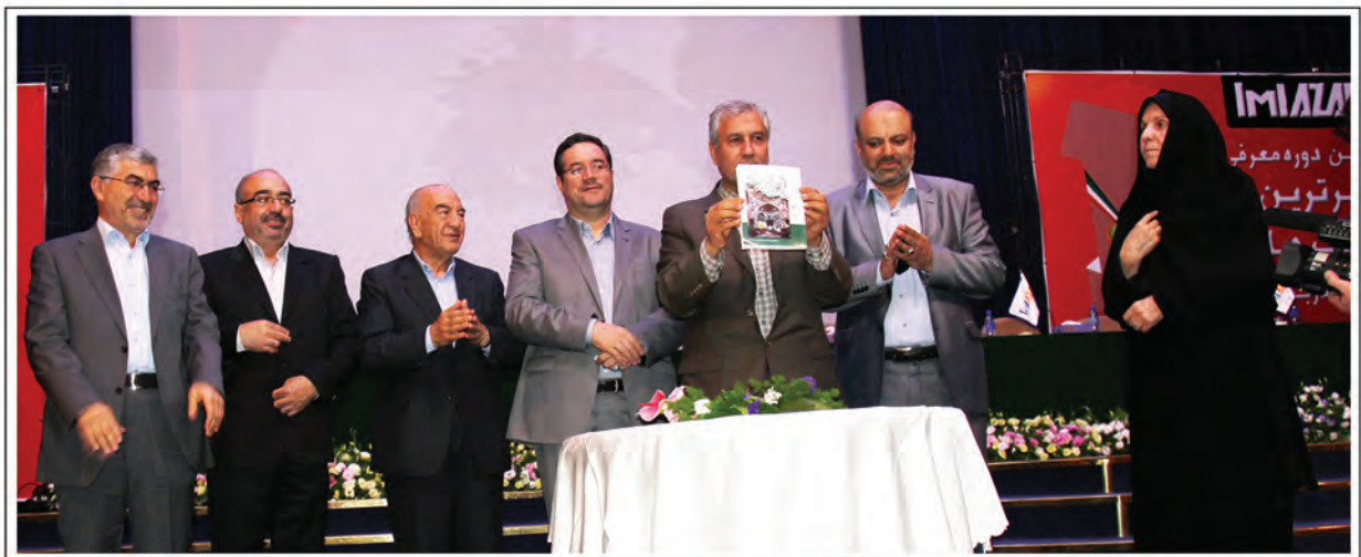
▲ رونمایی از کتاب سیمای صنعت و اقتصاد آذربایجان شرقی با حضور وزیر محترم تعاون، کار و رفاه اجتماعی