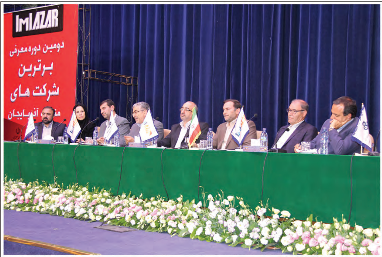
▲ برگزاری میزگرد تخصصی با موضوع راهکارهای حمایت بیش از پیش از برترین شرکت های منطقه آذربایجان با حضور مقامات و مدیران بخش دولتی و خصوصی